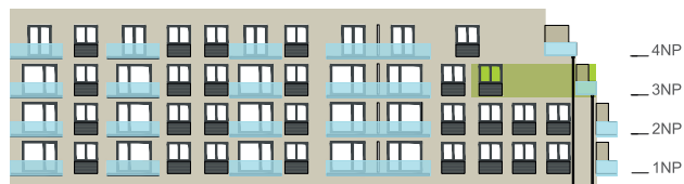
Východní pohled na dům / Building View - east side